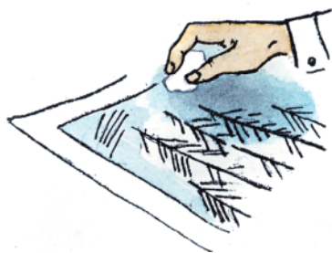
Рисунок тушью легко освежить, аккуратно протерев ваткой, смоченной подсолнечным маслом. Количество масла должно быть минимальным!